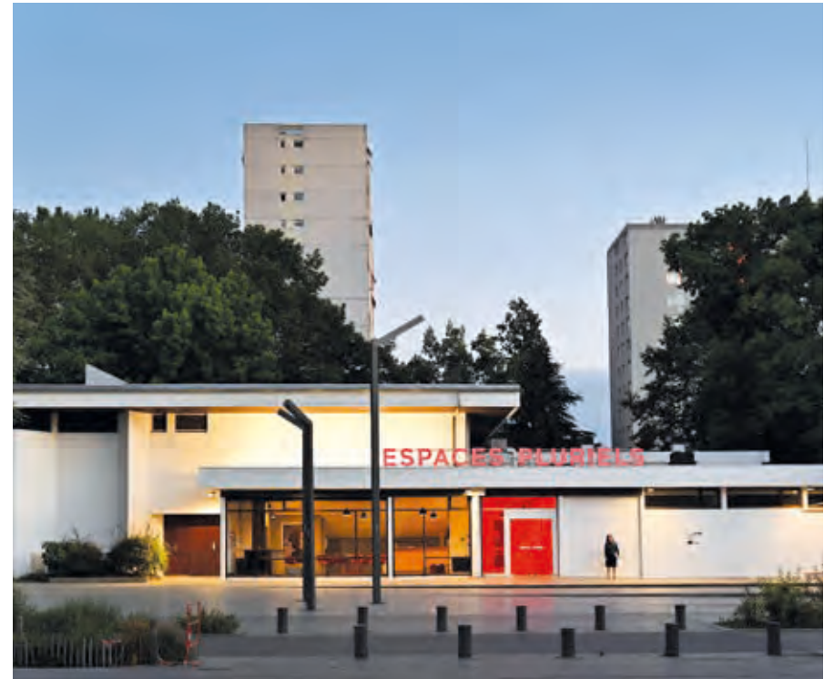
THÉÂTRE SARAGOSSE